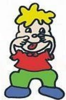
Se abrió una ventana, se abrió la otra, llamaron al timbre ... y salió la loca.