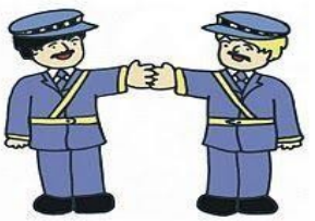
Llegaron 2 policías: ¿Qué pasa aquí?