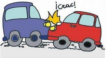
Chocaron dos coches