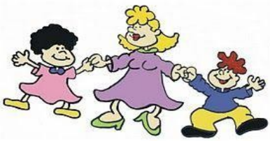
la gente venía así!